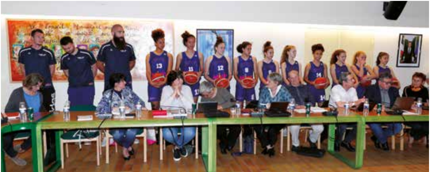
Mise à l'honneur de l'équipe féminine U15 Élite du C.B.S.L (Basket-ball)