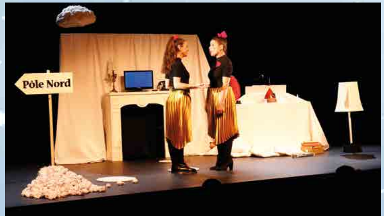
Spectacle « Noël à pleins tubes », Cie Une petite voix m'a dit