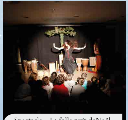
Spectacle « La folle nuit de Noël », Cie L'arbre qui chante