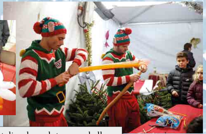
Atelier de sculpture sur ballons