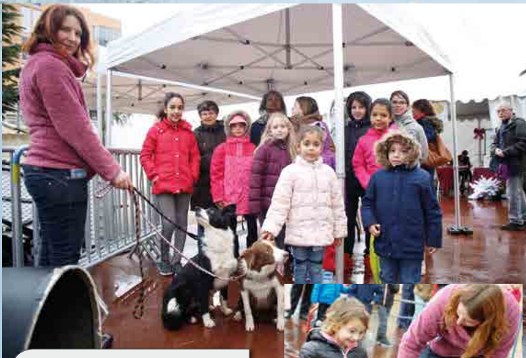
Parcours canin Agility