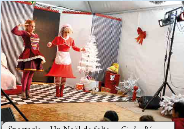
Spectacle « Un Noël de folie », Cie La Réserve