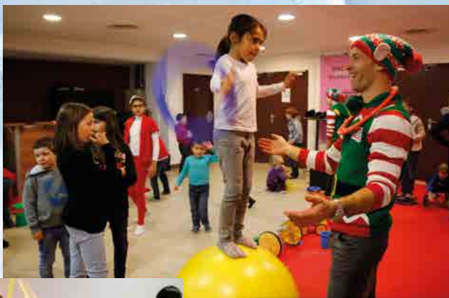
Initiation au cirque