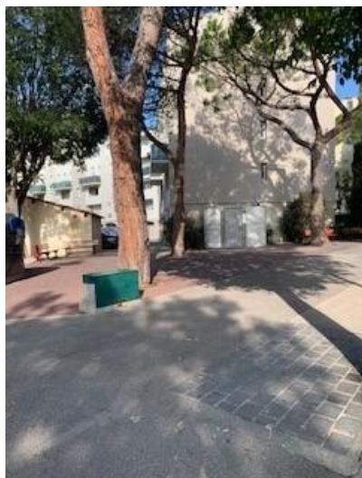
1 Rue de l'Aspre sur le trottoir à Carros ville